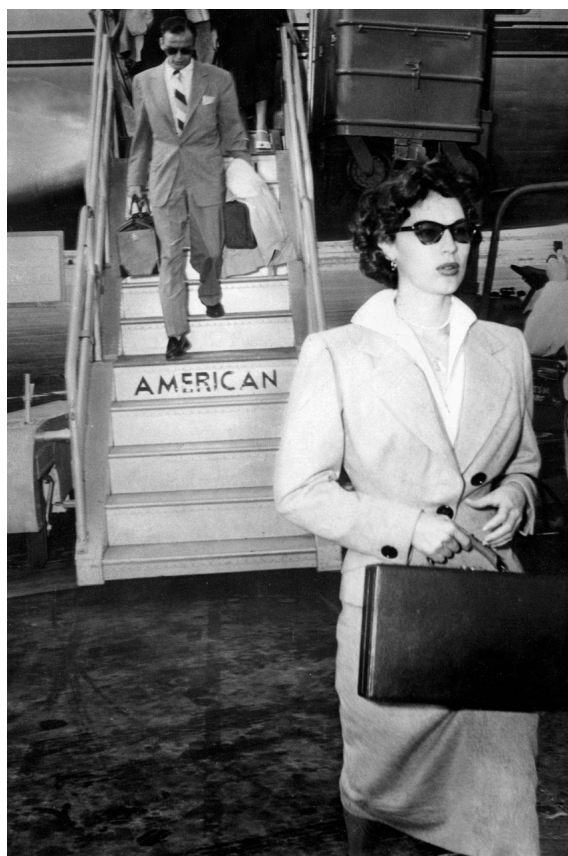
Casal famoso que desembarca