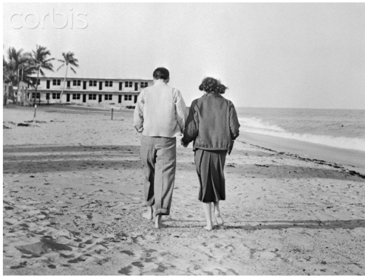
Casal famoso em lua de mel