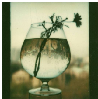
Polaróide de André Kertész