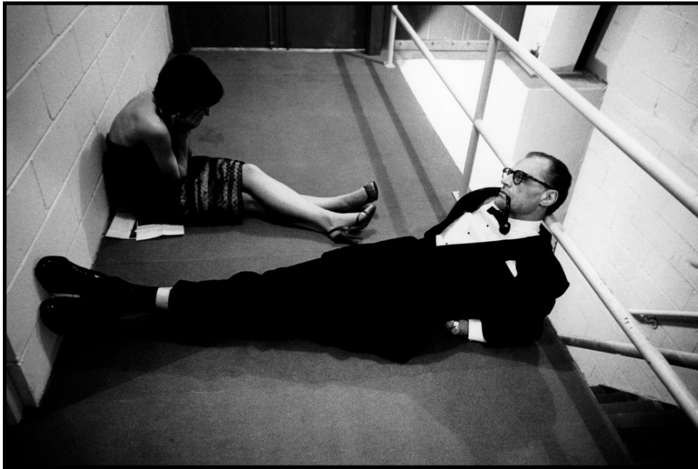
Arthur Miller and his wife Inge Morath waiting backstage at the Lincoln Center Repertory Theater on the opening night of After the Fall